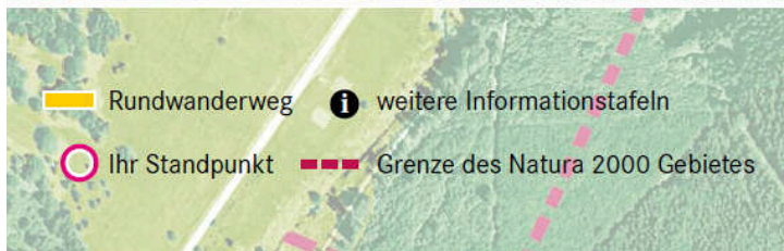
Rundweg bei Tranenweiher

Stiftung Natur und Umwelt Rheinland-Pfalz