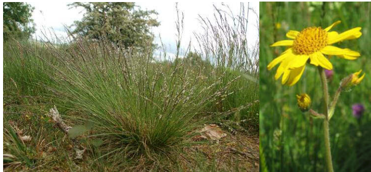
Borstgras ( Nardus stricta ) und Arnika ( Arnika montana )

Weitere Informationen zum Projekt finden Sie auch unter www.life-arnika.eu .