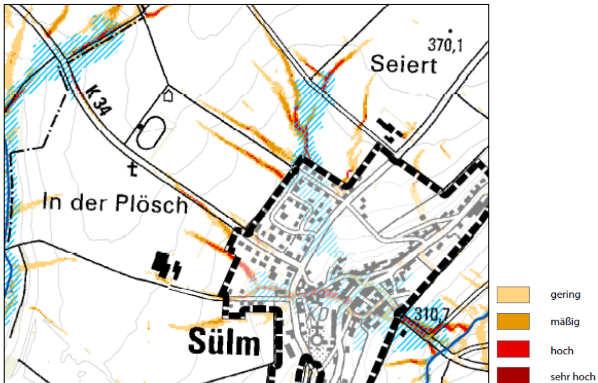
Abb. 2: Sturzflutentstehungsgebiet - Abflusskonzentration

Im Flachland werden die Klassengrenzen der Einzugsgebietsgröße in Anpassung an die geringeren Fließgeschwindigkeiten bei sehr geringen Hangneigungen verschoben: